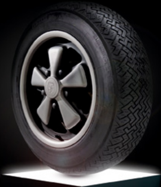
Abbildung: PIRELLI CINTURATO™ CN36™

Moderne Technologie. Authentische Emotionen.