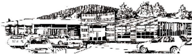
Treffpunkt Thierolf - Zweigbetrieb Höchst Aschaffener Str. 71 · 64739 Höchst i. Odw. · Tel: 0 61 63 - 93 33 0

Das Autohaus im Odenwald – seit über 90 Jahren.