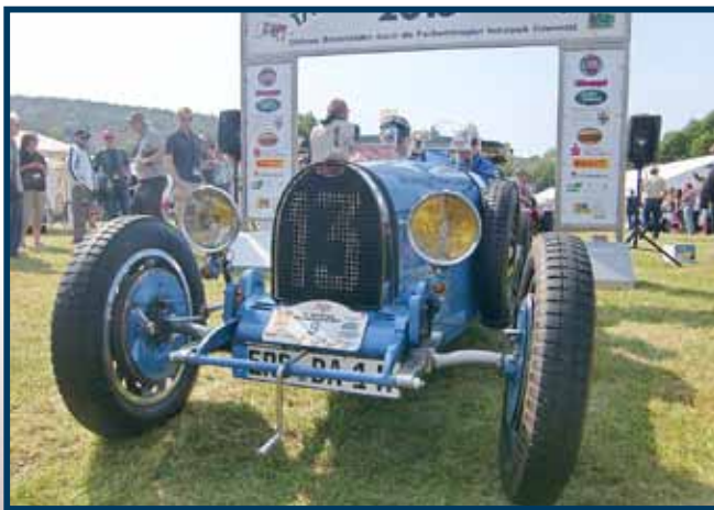
Am Start können sie einen echten Bugatte röhren hören

Mit viel Engagement und Ausdauer starten die Organisatoren in die Jubiläumsausgabe „25 Jahre Bad Königer Klassikerfestival“. Im Jahr 2013 sahen 25.000 Besucher rund 2.500 Oldtimer, Youngtimer und Sportwagen, sowie 385 Traktoren und 20 historische Omnibusse. An diesen großen Erfolg möchte das Organisationsteam 2015 mit den Highlights „BITTER & die großen OPEL“ , sowie „EICHER & das EICHERRAD“ erneut