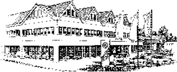
Treffpunkt Thierolf - Hauptbetrieb Michelstadt Hammerweg 29 · 64720 Michelstadt · Tel: 0 60 61 - 70 90