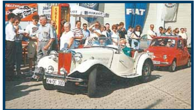
MG TF und FIAT 500 am Start 1994 letztmals auf dem Firmengelände Hegny