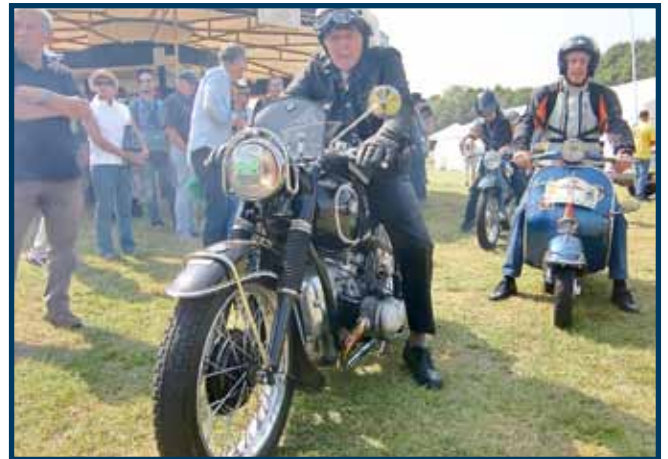
Motorrad und Motorroller fahren sind auch wie ... am Start zur Nibelungen Klassik Ausfahrt

Die Jubiläumsausgabe des Bad Königer Klassikerfestival startet an beiden Tagen jeweils mit rund 120 Fahrzeugteams auf die Strecken der „Nibelungen Klassik“ (samstags) und „Britisch-Italienischen Klassikerausfahrt“ (sonntags). Vorkriegsfahrzeuge starten an beiden Tagen zusätzlich zur „Nibelungen Historic“. Die Strecken führen auf wenig befahrenen Nebenstrecken durch die Fachwerkregion Odenwald und sind an beiden Tagen etwa 70 Kilometer lang. Die Tradition mit vielen Vorkriegsfahrzeugen zu starten, soll auch in diesem Jahr erneut gelebt werden. Vom Fiat Balilla und Ford A bis zum seltenen Bugatti und Lagonda erwarten die Veranstalter ein buntes Feld. Traditionell sind auch die Klassen der 50er und 60er Jahre gut belegt. Neben zahlreichen Jaguar, MG und Triumph starten hier aber auch Fiat Topolino, Alfa Romeo Spider, Opel Rekord und viele Mercedes. Den Gesamtsieger stellten 2013 die DeLorean Fahrer, die auch 2015 wieder antreten um den Siegerpokal zu verteidigen. Zahlreiche Präsentationen rund um die Traktoren und das EICHERRAD, sowie die automobilen Sonderausstellungen, lassen die Gedanken in längst vergessenen Jahrzehnte reisen. Schauen Sie sich die Oldtimer an.