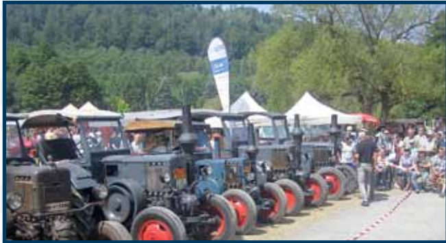
Die Lanzfreunde stellen sich auf dem Wettglühen

ausreichend Fläche zum Picknicken und zum Ausstellen der Oldtimer und Sportwagen zur Verfügung. Jeder Oldtimer-Liebhaber ist herzlich willkommen! Die Künstlerinsel stellt bereits zum zweiten Mal eine einzigartige Verbindung zum technischen Kulturgut her. So trifft auch in diesem Jahr Kulturgut auf „Kunst und Design“.