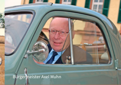
Bürgermeister Axel Muhn