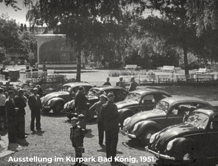
Ausstellung im Kurpark Bad König, 1951.